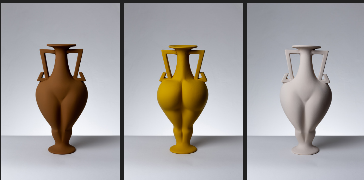
Fotografia di prodotto | IAMMI

Con la fotografia di Still life si possono raccontare molte cose del prodotto. Questo genere fotografico puó essere ricreato sia in studio che su un set allestito appositamente in location dedicate.